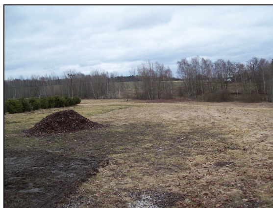
Místo zařízení staveniště a deponie