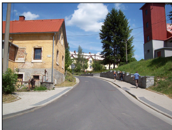
Odbočení ulice Školní z ulice Revoluční