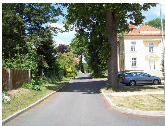
Odbočení ulice Hasičská z ulice Školní