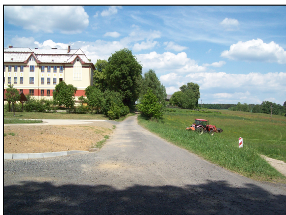
Ulice Luční – vpravo pozemek deponie