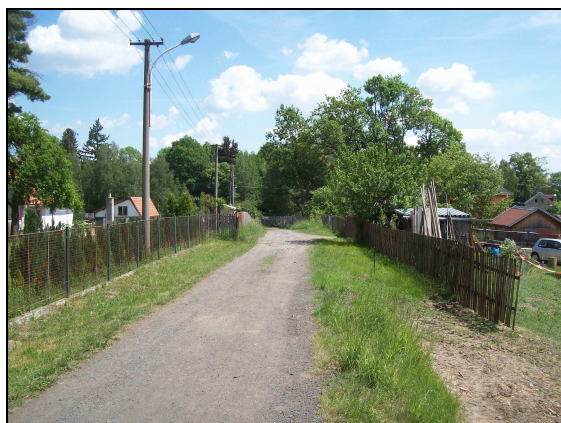
Možnost jednorázové dopravy rypadla