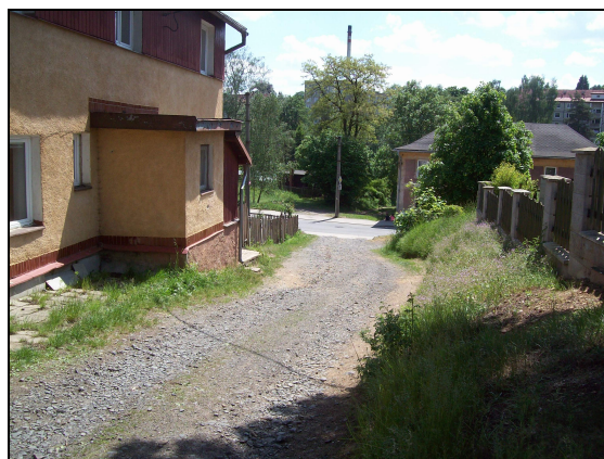
Vyústění této komunikace na Revoluční

Konečné uložení sedimentu a přebytečné zeminy bude na pozemcích v k.ú. Plesná (p.č. 181/1 - část), k.ú. Velký Luh (p.č. 178/1 a 201/1) a k.ú. Křižovatka (p.č. 50/2). Souhlasy zástupců Města Plesná a obcí Velký Luh a Křižovatka jsou uvedeny v příloze E. Dokladová část.