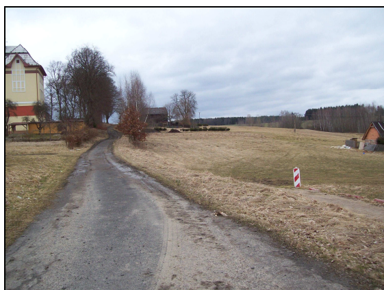
Ulice Luční – vpravo pozemek deponie