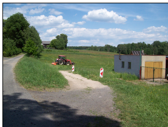
Sjezd na pozemek deponie